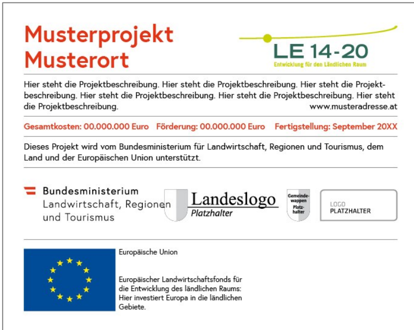
Abbildung 4.5.: Erläuterungstafel – bei mehr als 50.000 Euro öffentlicher Unterstützung.