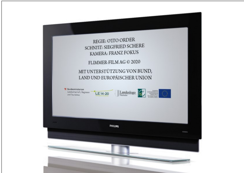
Abbildung 4.4.: Förderhinweis Filmabspann.