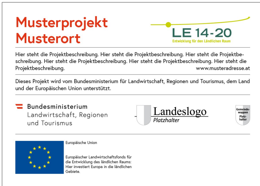
Abbildung 4.7.: Poster (optional)