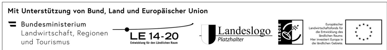
Abbildung 0.: Logoleiste „Mit Unterstützung von Bund, Land und Europäischer Union (LEADER)“ in schwarz-weiß.

am Beispiel der Förderkombination Bund, Land und Europäische Union (LEADER):