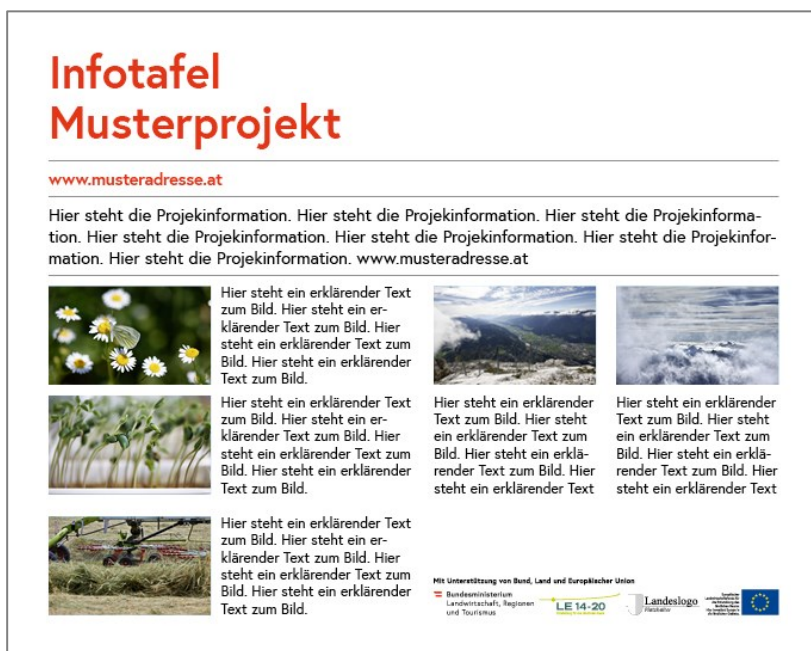
Abbildung 4.8: Informationstafel mit Projektbeschreibung (optional)